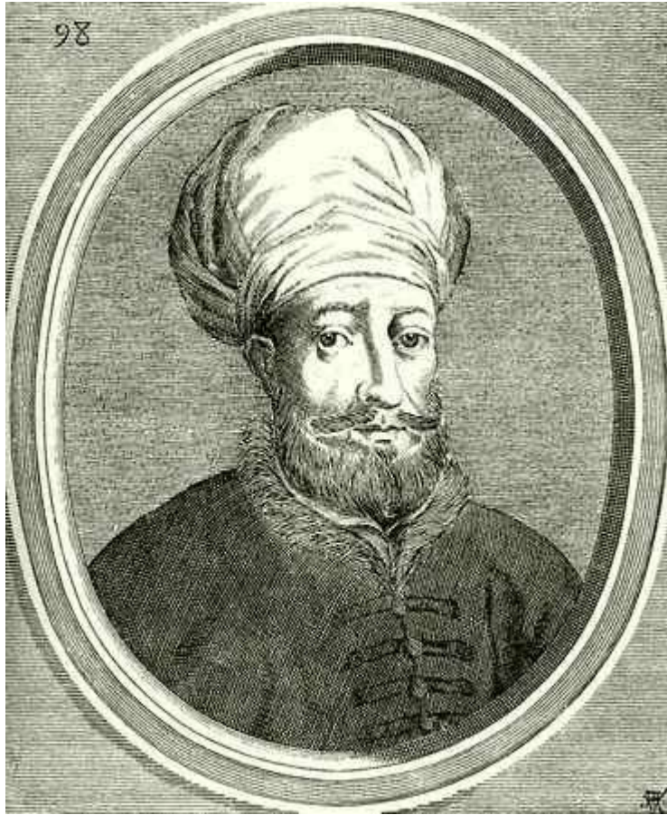
Kücsük Mehmed pasa

nagyszöllősi csatában megverte Kemény Jánost; Kemény a harc közben életét is veszítette. 99 S az ő erdélyi tartózkodása tette lehetővé a váradai vilájet ugyancsak túlzó – és sok vitára okot adó – összeírását. Az 1663. évi harcok idején Várad őrzését bízták rá, ahová a következő év elején hivatalosan is kinevezték. 1664-ben az északi fronton tevékenykedett, jelen volt a zsarnócai csatában, s hamarosan Érsekújvár pasája lett. 1667 elején azután visszakerült Temesvárra, majd újra Újváron szolgált (1669. májustól). 1671 októberében ismét Váradra rendelték. Itt tűnik el a szemünk elől 1672 végén.