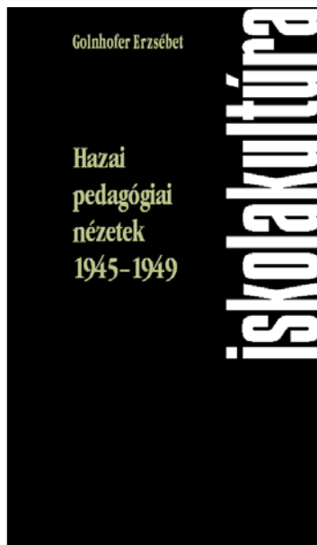
Az Iskolakultúra könyveiből

Zátonyi Sándor (1992): Az általános iskolai reformok tapasztalatai és tanulságai. Új Pedagógiai Szemle , 2.